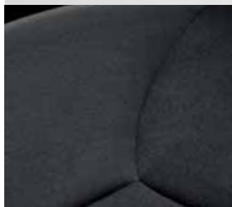
Irazu fekete kárpit (AYGO)