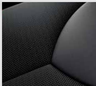
Haruna szürke kárpit (AYGO+)