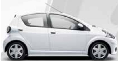
Hűvös fehér (068)